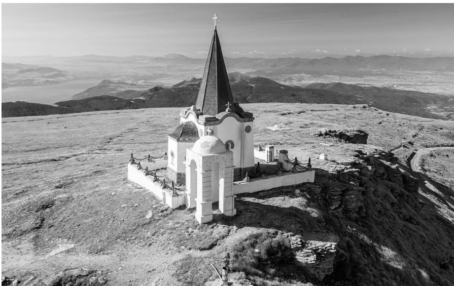
Сл. 3. Капела на Кајмакчалану